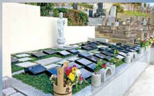
※第1期完売・第2期販売開始