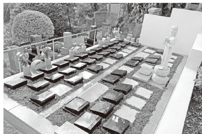
斜め上から見た横浜慶珊寺樹木葬墓地